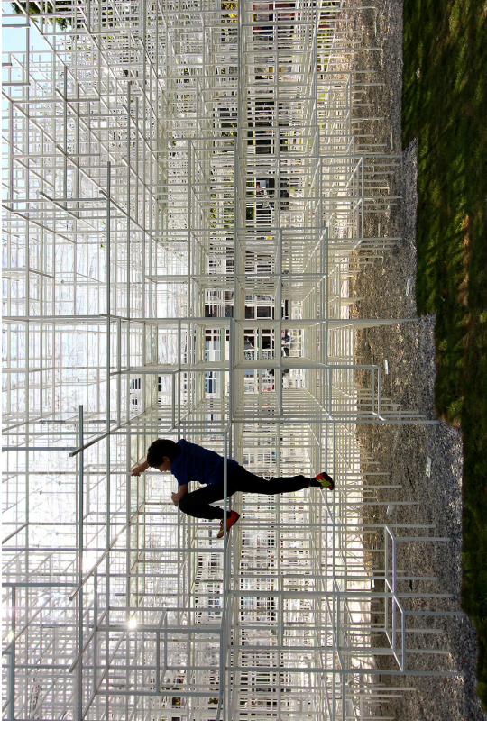
Serpentine Gallery Pavilion , 2013, Londen, Engeland. Architect: Sou Fujimoto.