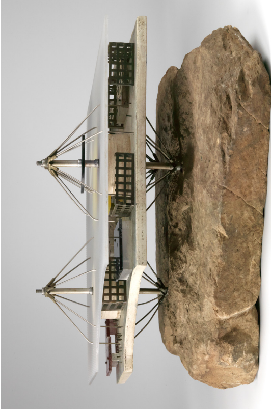
Constant, Hangende sector II , 1960, 52 x 37 x 22 cm, messing, staaldraad, spijkers, raderijtjes, olieverf op hout en steen, Collectie Defares.