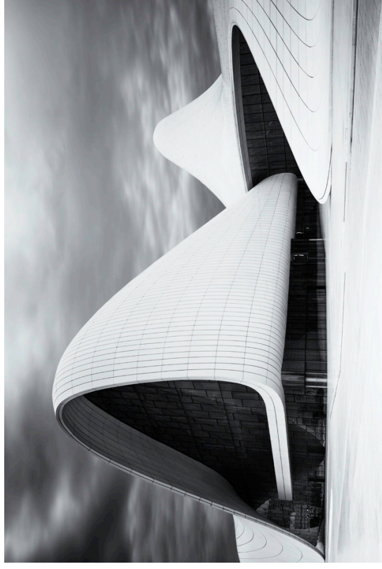
Heydar Aliyev Center building , 2012, Baku, Azerbajjan. Architect: Zaha Hadid.