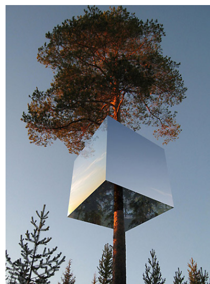
The Tree Hotel (The Mirror Cube) , 2010, Harads, Zweden. Architect: Tham & Videgård.

1. Utopia wordt voor het eerst beschreven in het gelijknamige boek uit 1516 van de Engelse geleerde Thomas More, waarin hij de ideale stad of staat beschrijft.